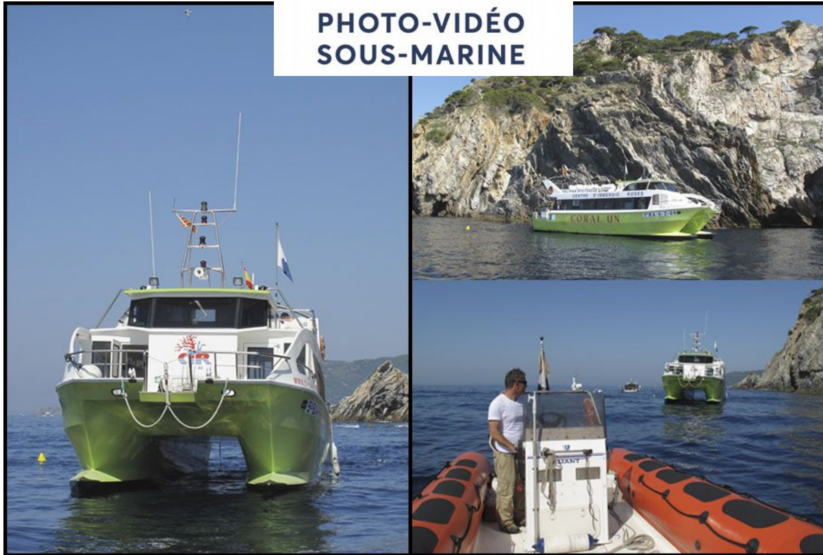
Figure 1: Le club de plongée : bateau spacieux "catamaran"

www.cir-roses.com – www.facebook.com/CIRRoses