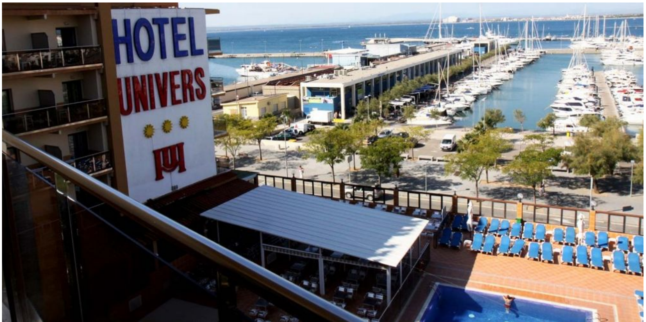
Figure 2: L'hôtel directement sur le port, accès direct au club de plongée à pied

www.cir-roses.com – www.facebook.com/CIRRoses